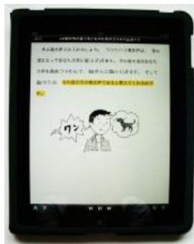
ipad 再生画面『LD・学び方が違う子どものための サバイバルガイド』(明石書店)より